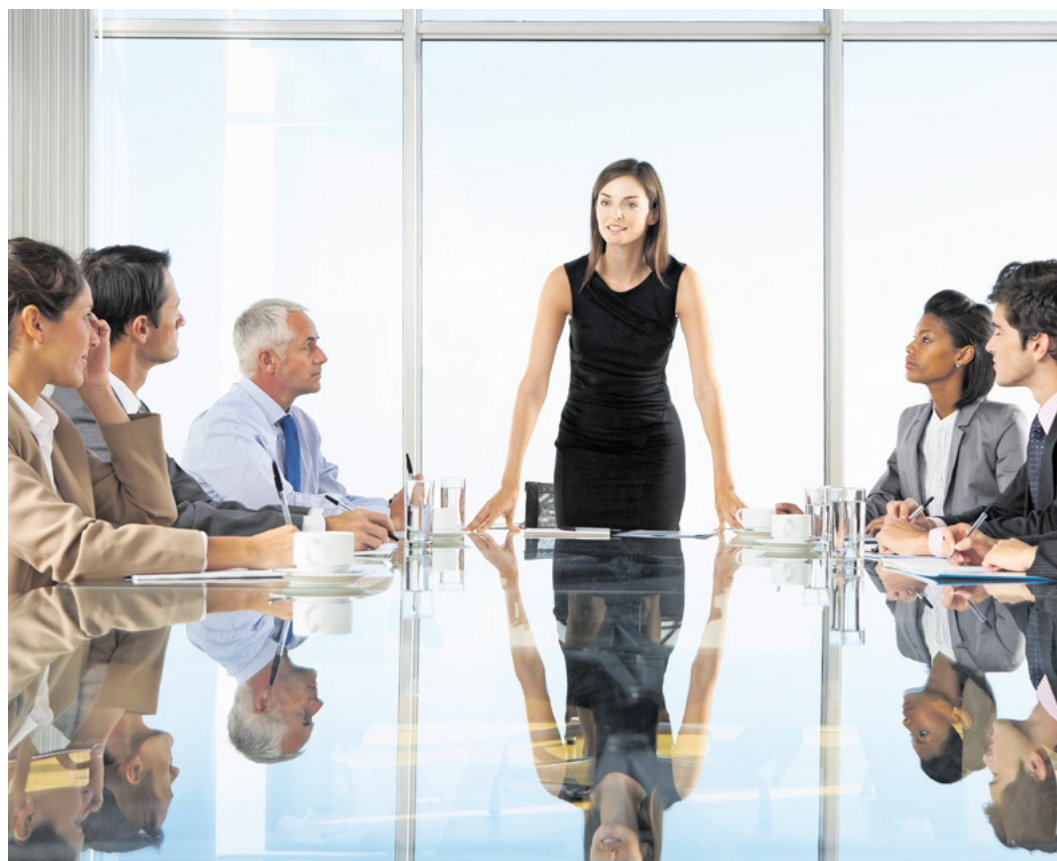
De plus en plus nombreuses aux postes de direction: elles y sont représentées à plus de 50% dans les PME.

Femmes PME Suisse, le réseau féminin de l'usam: www.kmufrauwenschweiz.ch/nc/fr.html www.sgv-usam.ch