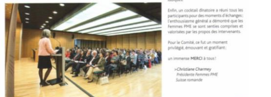
Mensuel de la Chambre neuchâteloise du commerce et de l'industrie « Repères » - novembre 2015