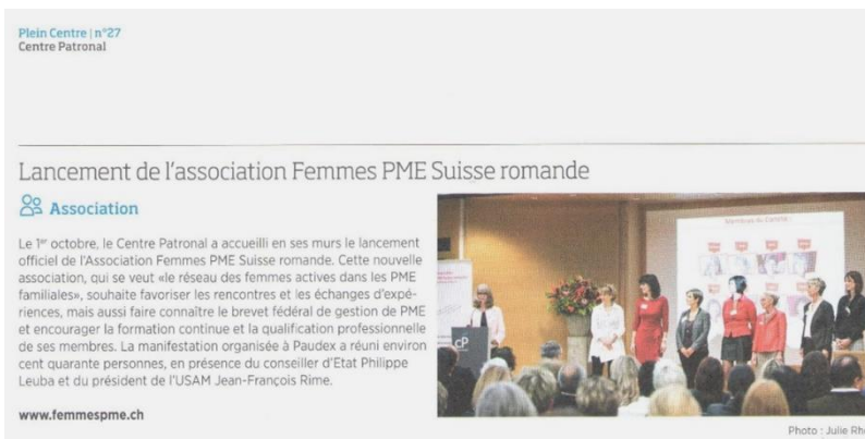
Plein Centre – Publication du Centre patronal – novembre 2015