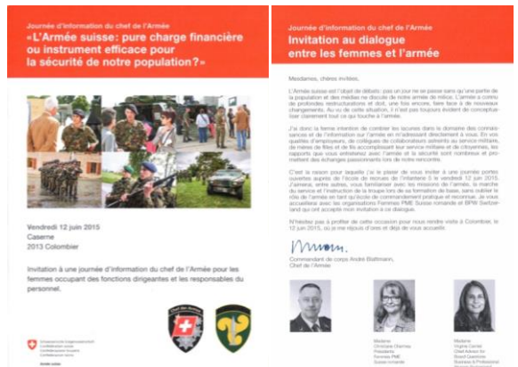
Invitation Armée Suisse – 12 juin 2015