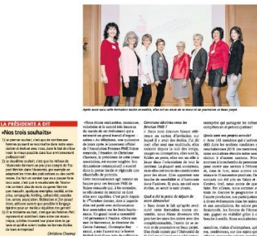
Journal de l'Union Suisse des arts et métiers – novembre 2015