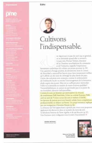
Magazine Focus PME – juin 2015