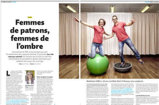
Magazine Migros – 15 juin 2015