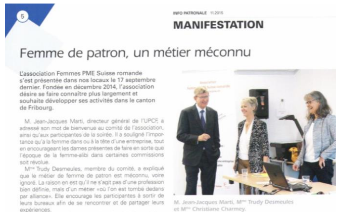
Journal de l'Union professionnelle du Canton de Fribourg – octobre 2015