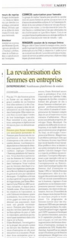
Journal L'Agefi - juin 2015