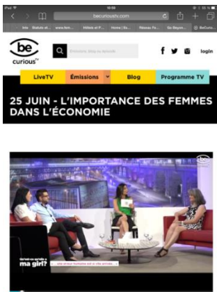
Chaîne BeCurious – débat – 25 juin 2015