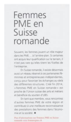
Journal UBS – Impulse - 2 e semestre 2015