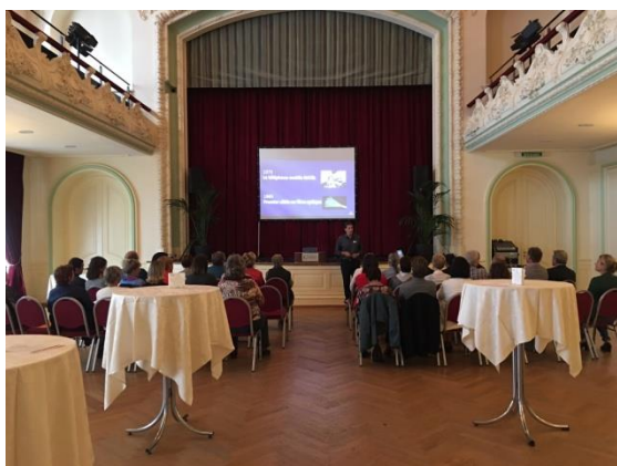
Casino de Morges - Swisscom - 6 octobre 2016