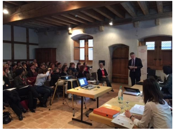
Assemblée générale - 8 mars 2016