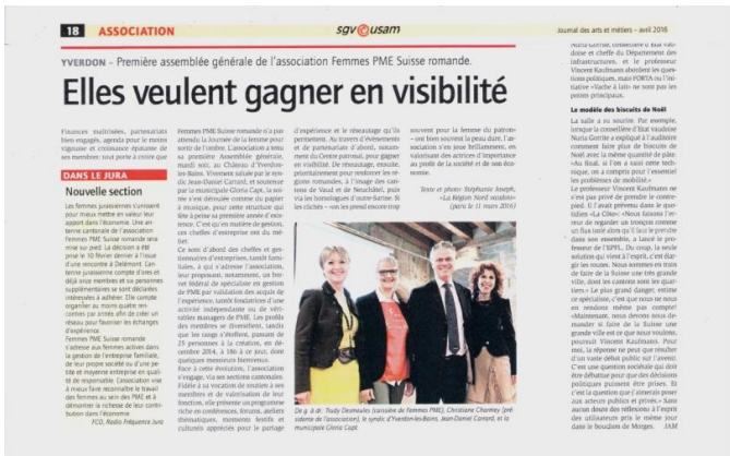
Journal de l'usam - mars 2016