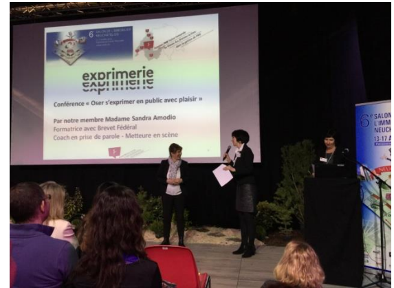
SINE - Salon de l'Immobilier NEuchâtelois - 16 avril 2016