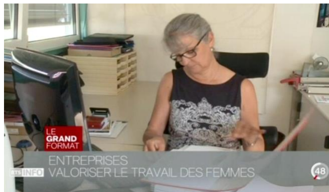
RTS - TJ du 19.30, « Le travail des femmes dans les PME est souvent sous-estimé » - 11 octobre 2016