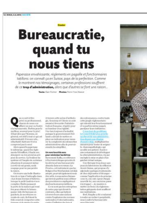
Migros Magazine - juin 2016