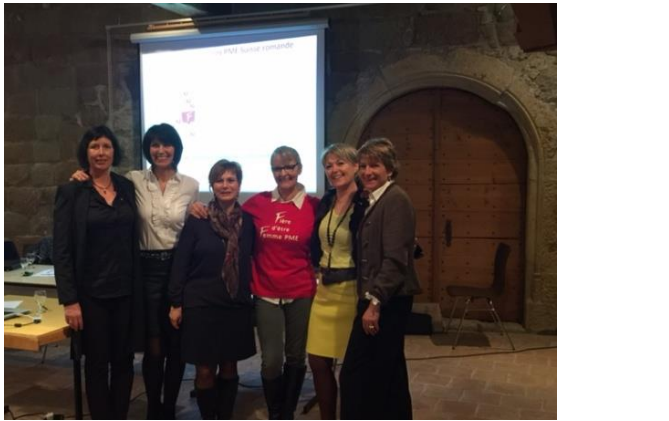
Assemblée générale - 8 mars 2016